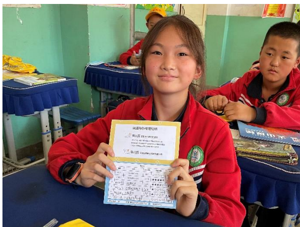
左图-学生展示自己的阅读存折记录

阅读交换活动根据不同教师对于时长及活动形式的需求，提供了多种阅读交换方案，促使学校及教师更便捷及有效开展阅读交换活动，形成校园书香阅读氛围。