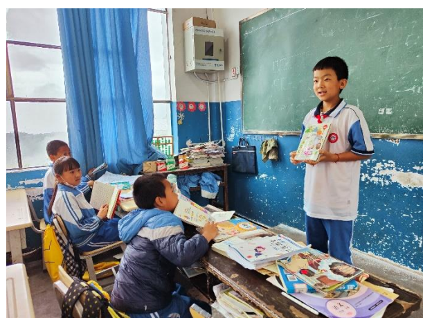
右图-学生在班级推荐自己的星囊图书