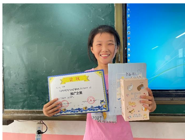
右图-开展阅读表彰活动