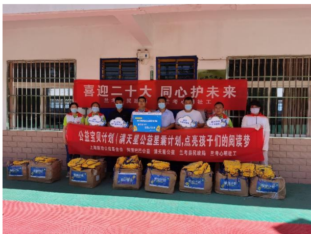
左图-联合当地部门开展星囊派发活动