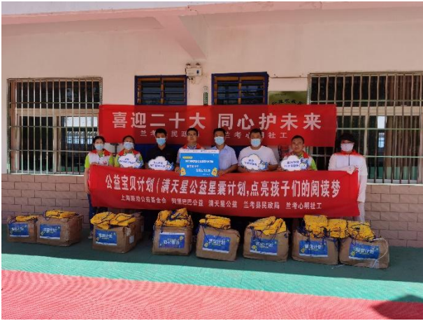
左图-联合当地部门开展星囊派发活动