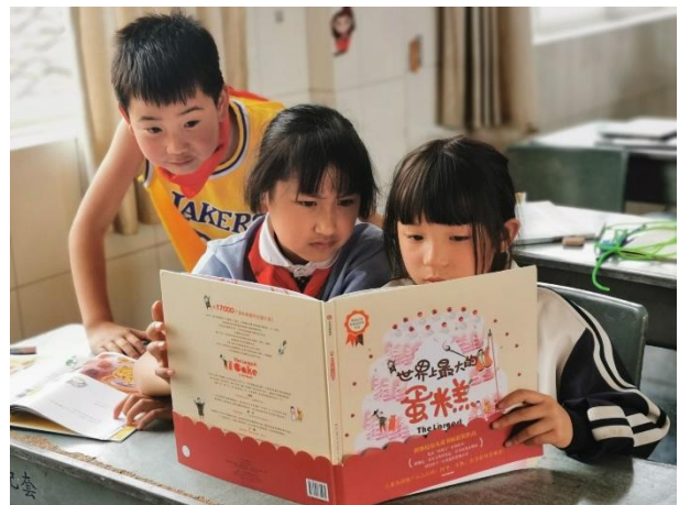
右图-学生在一起阅读星囊图书