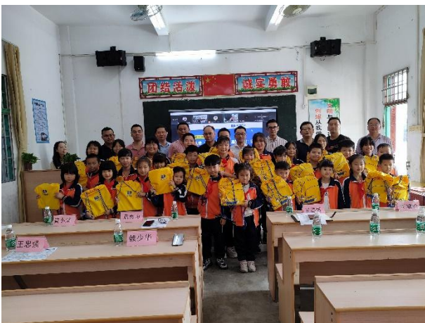
左图-联动线上线，开展星囊派发活动