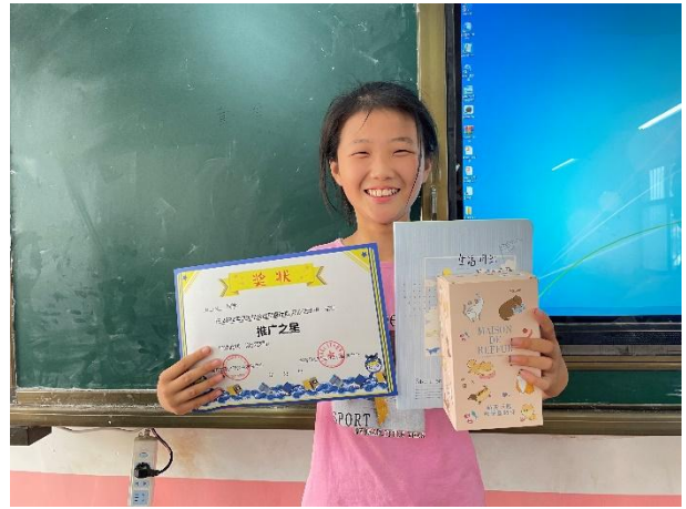
右图-开展阅读表彰活动