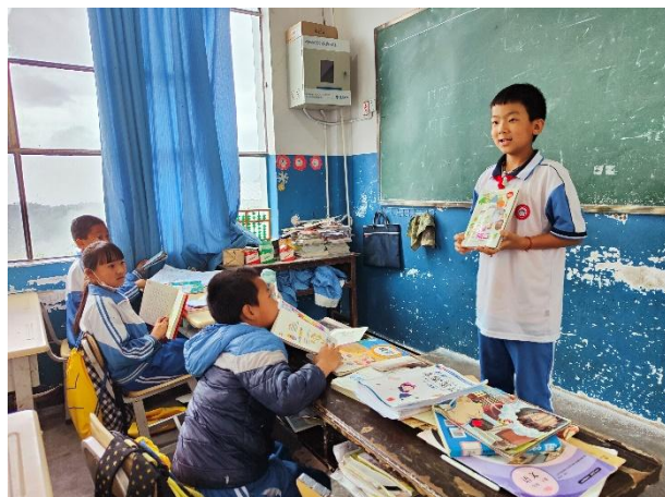
右图-学生在班级推荐自己的星囊图书