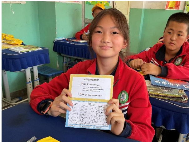
左图-学生展示自己的阅读存折记录

阅读交换活动根据不同教师对于时长及活动形式的需求，提供了多种阅读交换方案，促使学校及教师更便捷及有效开展阅读交换活动，形成校园书香阅读氛围。